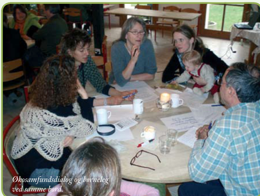
Økosamfundsdialog og børneleg ved samme bord.

Der er økologisk byggeri, CO 2 -neutrale opvarmningsformer, lokal rensning af spildevand, delebiler, genbrugsordninger og meget mere. Leve- og arbejdsfællesskaber, fælleshuse med fællesspisning, underholdning, børnepas-